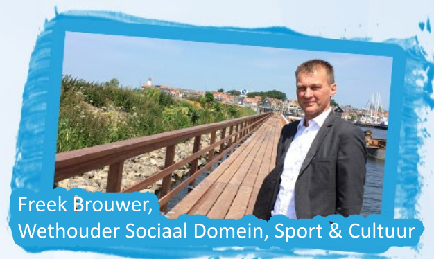
Freek Brouwer, Wethouder Sociaal Domein, Sport & Cultuur